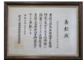
「体力づくり」で文科省表彰