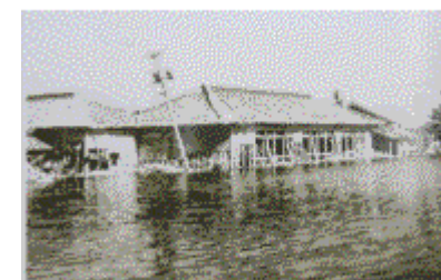
伊勢湾台風で被害が出た校舎