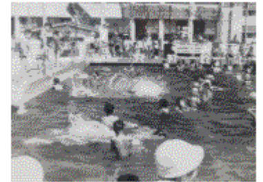
道路南側にあったプール