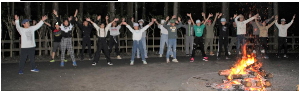
5年生 ダンス 「青と夏」