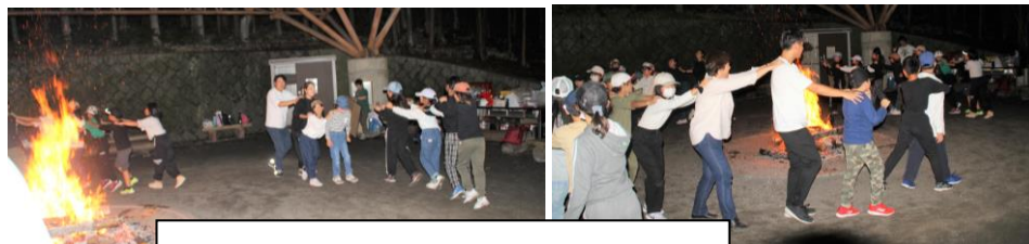
「じゃんけん列車」を楽しみました。