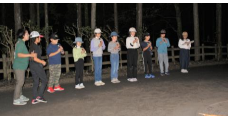
4年生 リコーダー演奏 「紅蓮華」「新時代」