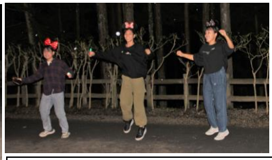
ボランティア出し物 「ジャンボリーミッキー」