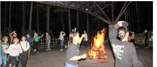
みんなで踊りました！