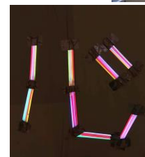
火文字「心」 めあて 心のリレー を表しました。