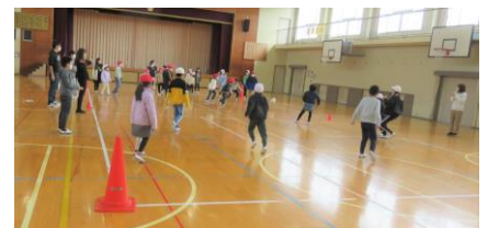
どれも楽しい名前ですね！