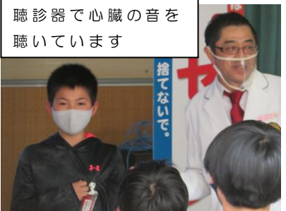
聴診器で心臓の音を聴いています