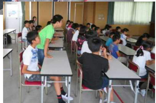
【スマホ・ケータイ安全教室】