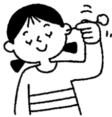
定期的に耳掃除をする (しすぎにも注意)