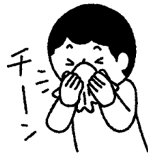
鼻をつよくかみすぎない (片方ずつ)