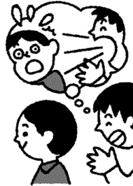
人の耳元で大声を出さない (ふざけて叩いたりしない)