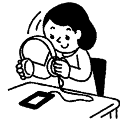
ヘッドフォンの音量は控えめに (時間を決めて)