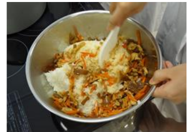
【かきましを作っている様子】

こんげつ 今月のかきましは、今が旬の“ふき”を入れて、“春のかきまし”にしました。