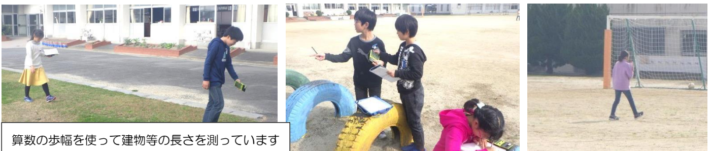
算数の歩幅を使って建物等の長さを測っています