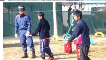
1年生とのふれあい