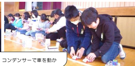
コンデンサーで車を動か