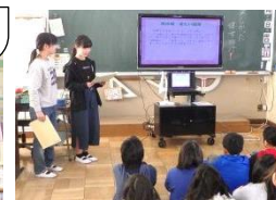
5年生へ修学旅行プレゼン