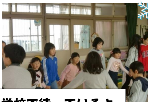
栄南小学校で待っているよ